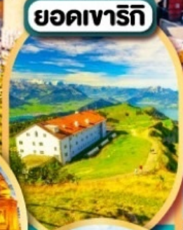
ยอดเขาริก