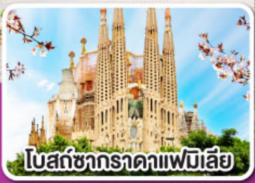
โบสถ์ซากราตาแฟมิเลีย