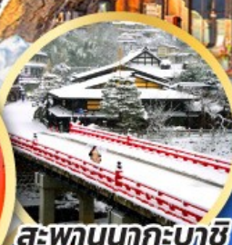
สะพานนากะบาชิ

ชมเมืองแห่งสายน้ำ บรรยากาศย้อนยุค "กุโจะจิมัง"