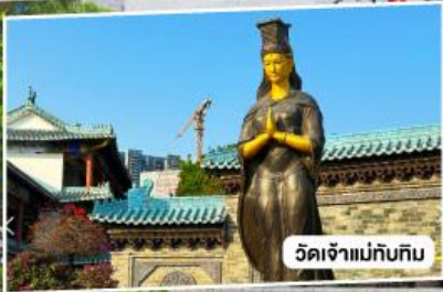
วัดเจ้าแม่กั๊กทิม