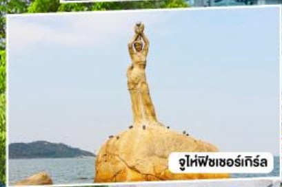
จูไห่ฟิชเชอร์เกิร์ล