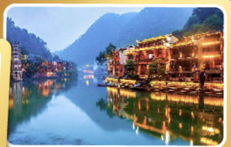
เมืองโบราณเฟิ่งหวง