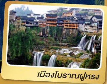
เมืองโบราณฝู่หรง

เที่ยวครบสูตร ฟู่หรง ฟิ่งหวง 6 วัน 5 คืน