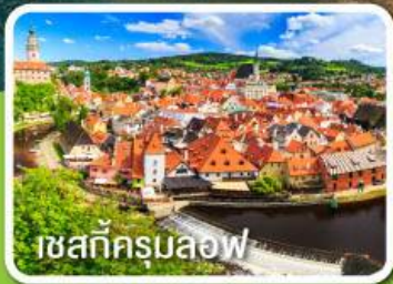
เชสท์ครุมลอฟ