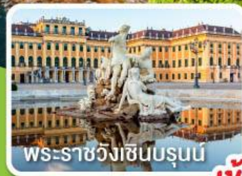
พระราชวังเชินบรุนน์