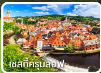
เชสท์ครุมลอฟ