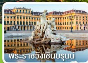
พระราชวังเซินบรุนน