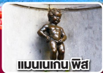
แมนเนเกน พิส