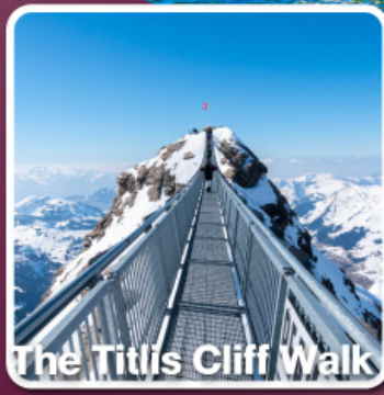
The Titlis Cliff Walk