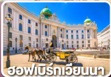
ฮอฟบวร์กเวียนนา

ตามรอยซีรีส์ Crash Landing on you ที่ทะเลสาบเบรียนซ์