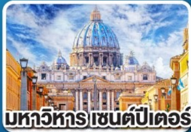
มหาวิหารเซนต์ปีเตอร์