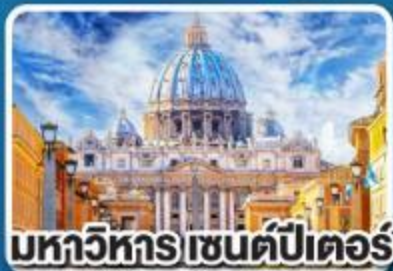
มหาวิหารเซนต์ปีเตอร์