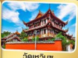
วัดเหวินชู่