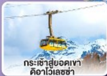
กระเช้าสู่ยอดเขา ดออาไวเลซซา