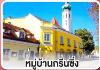
หมู่บ้านกรีนซิง