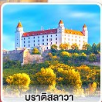
บราติสลาวา

เยือนหมู่บ้านกรีนซิง แห่งออสเตรีย พร้อมอาหารค่ำแบบ “ฮอยริเก้”และไวน์สด