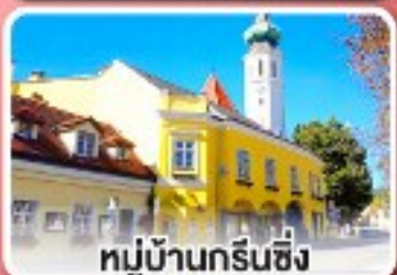
หมู่บ้านกรีนซิง