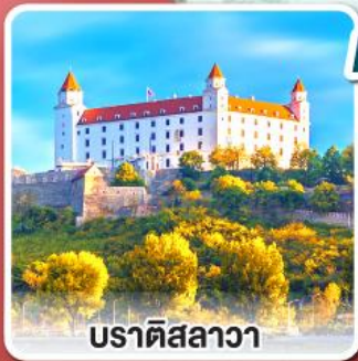
บราติสลาวา

เยือนหมู่บ้านกรีนซิง แห่งออสเตรีย พร้อมอาหารค่ำแบบ “ชอยริเก้”และไวน์สด