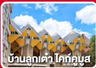
บ้านลูกเต่า โคทคูบุง