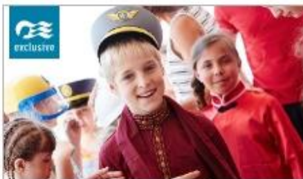
Discovery at SEA Programs

On every Princess ship, you'll find so many ways to play, day or night. Explore The Shops of Princess, celebrate cultures at our Festivals of the World or learn a new talent — our onboard activities will keep you engaged every moment of your cruise vacation. 1