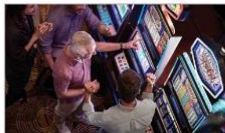
Vegas Style Casino