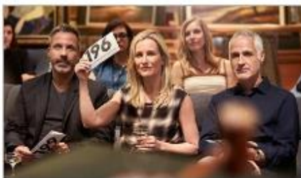
Art Gallery & Auctions