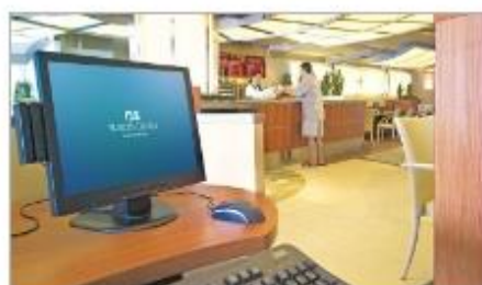
Internet Café & Library