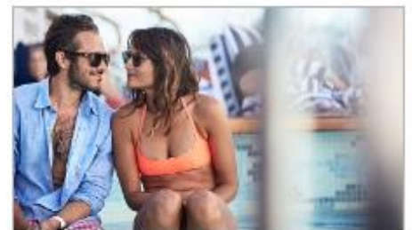
Freshwater Pools & Hot Tubs