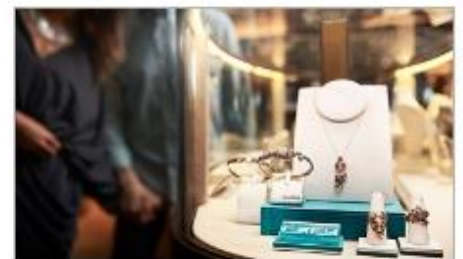
The Shops of Princess