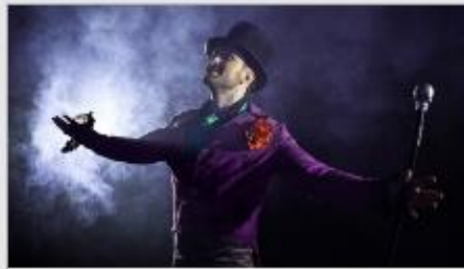
Featured Guest Entertainers