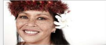
Festivals of the World