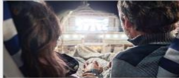
Movies Under the Stars®

On every Princess ship, you'll find so many ways to play, day or night. Explore The Shops of Princess, celebrate cultures at our Festivals of the World or learn a new talent – our onboard activities will keep you engaged every moment of your cruise vacation. 1