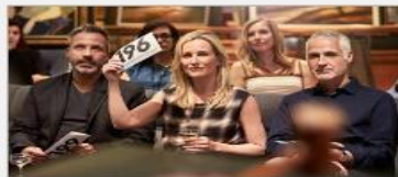
Art Gallery & Auctions