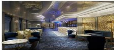
Princess Live! Café