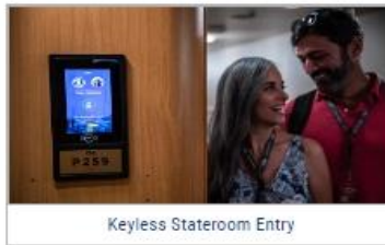
Keyless Stateroom Entry