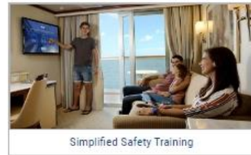
Simplified Safety Training