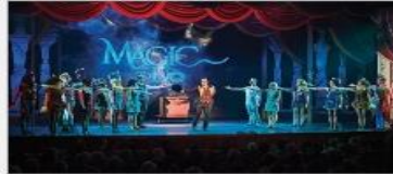
Original Musical Productions