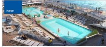
new Pools (Retreat, Wakeview, Top Deck)