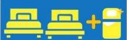
เตียง 3 ท่าน ที่นอนเสริม TRIPLE