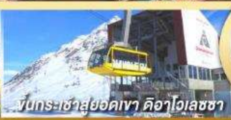
ขึ้นกระเช้าสู่ยอดเขา ดือาโกลเลซซา