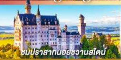
ชมปราสาทน้อยหวานส์ไตน์