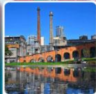
Eastern Suburb Memory Chengdu