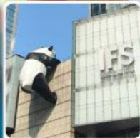
แพนด้ายักษ์ปิ่นตักIFS