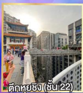
ตึกหุยซิง (ชั้น 22)