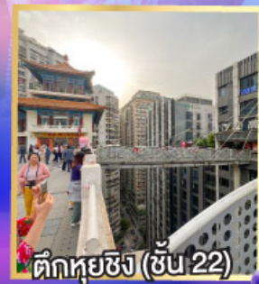
ตึกหุ่ยซิง (ชั้น 22)