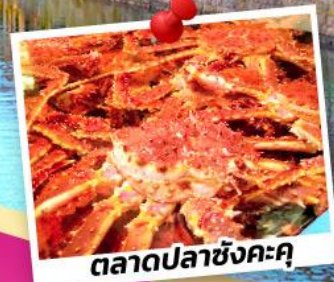
ตลาดปลาซังคะคุ