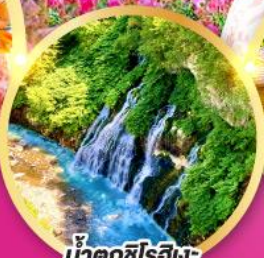
น้ำตกชิโรอิเงะ