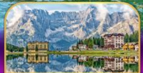
ทะเลสาบมิสุรีนา