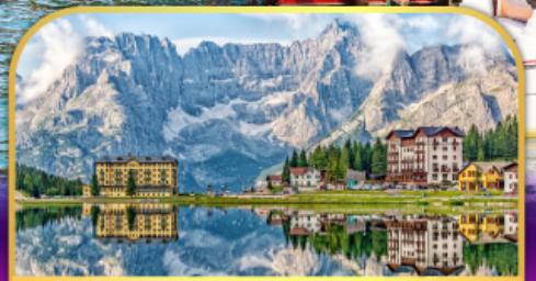
ทะเลสาบมิสุรีนา