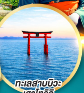
ทะเลสาบบิวะ เสาโทริอิ

เส้นทางสายอัลไพน์ทากายามา กำแพงหิมะ เพื่อนคู่โรเบะ