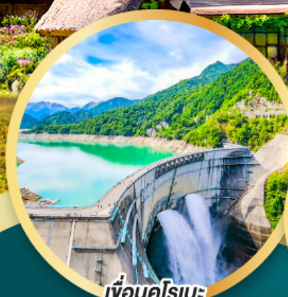
เพื่อนคู่โรเบะ