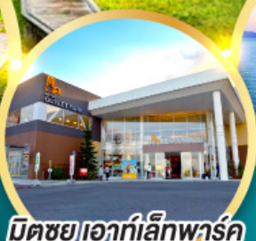
มิตรชยุเอากะอิเคฮาร์คคาโดมะ