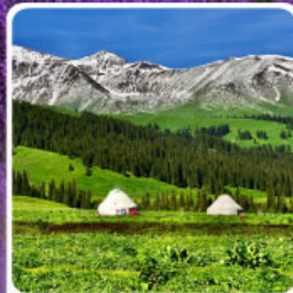
ทุ่งหญ้านาลาติ