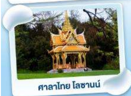
ศาลาไทย ไหลซานน์