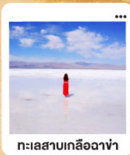
ทะเลสาบเกลือฉางซ่า