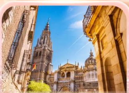
มหาวิหารแห่งโกเอลโด