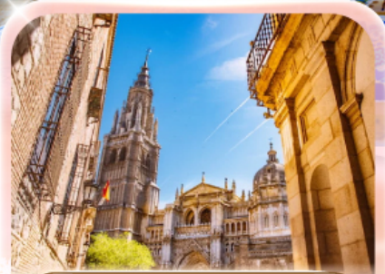
มหาวิหารแห่งโทเลโด

ซาอุดาที่กว้างยิ่งใหญ่ ยังไม่ทำใจ...ก็ให้เธอไปหมดแล้ว