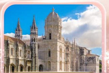
มหาวิหารเจอโรนีโม