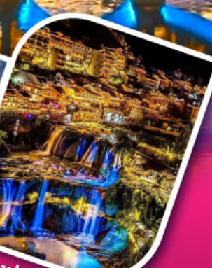
เมืองฝูหรงจิ้น