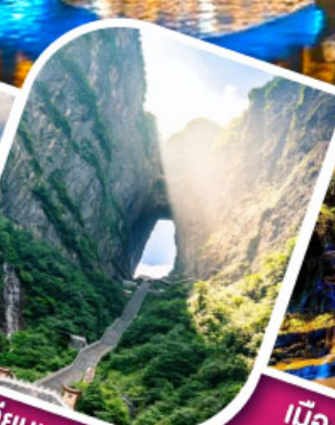
เจาเทียนเหมินทันฟ้าใส