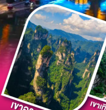
เจาอวตาร