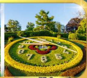
นาฬิกาดอกไม้เมืองเจนีวา

เดินทาง 9 วัน 6 คืน 09-17 ก.พ.69 22-30 มี.ย.69