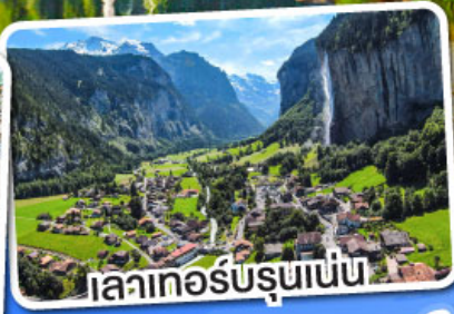
เลาเกอร์บรุนเนน