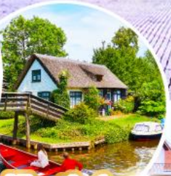
หมู่บ้านกีร์ซัน