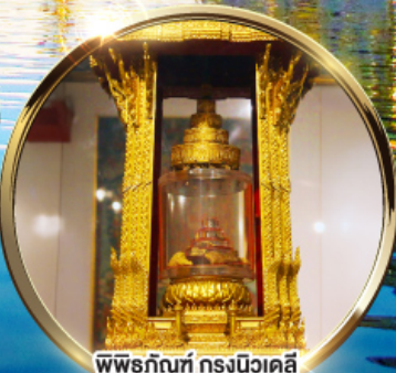
พิพิธภัณฑ์ กรุงนิวเดลี กราบนมัสการพระบรมสารีริกธาตุ