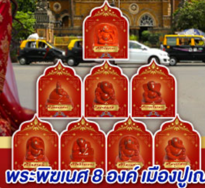
พระพิฆเนศ 8 องค์ เมืองปูเน่

" อินเดียครั้งนี้ ไม่ใช่แคร์ิป แต่คือการเปลี่ยนแปลง ปลุกพลังในตัวคุณ... ด้วยพิธีกรรมศักดิ์สิทธิ์ ณ สถานที่จริง ของพระพิฆเนศ ดินแดนแห่งปัญญาและพรสูงสุด"