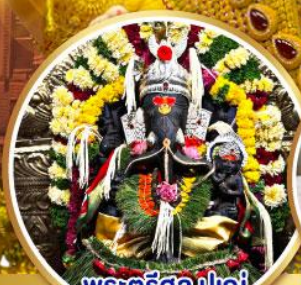
พระศรีศิว ปูणे (Trishul Pune)