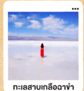
ทะเลสาบเกลือฉางซ่า