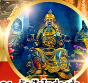
วัดปักโต้อ่องอำ