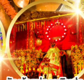
วัดเจ้าแม่กวนอิมอ่องอำ (สวนหนานเหลียน)