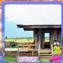
ร้านกาแฟหุบเขาคี๊อัน