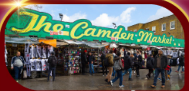
ตลาดแคมเดน