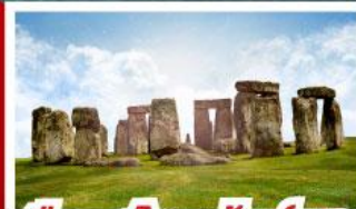
เยือนสโตนเฮ็นจ์ และ พิพิธภัณฑน์โรมันบาร