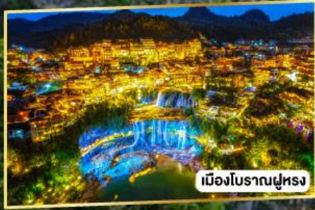
เมืองโบราณฝูหรง

เฟิ่งหวง ฝูหรงเจิ้น มนตร์งลิ่งแห่งขุนเขา และเมืองโบราณ 5 วัน 4 คืน