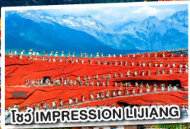
โชว์ IMPRESSION LIJIANG