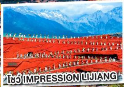
โซว์ IMPRESSION LIJIANG