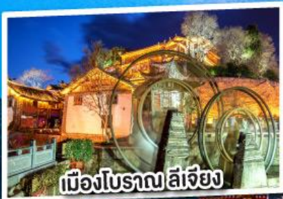
เมืองโบราณ ลี้เจียง