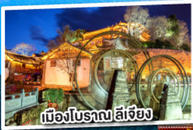
เมืองโบราณ ลี่เจียง