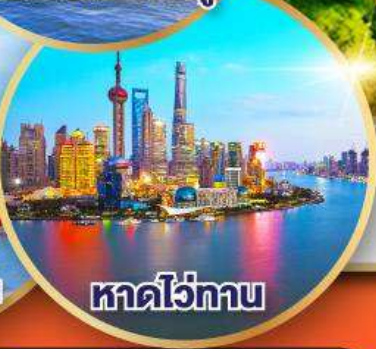
หาดไว่ทาน