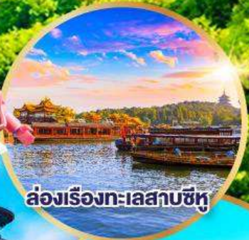
ล่องเรือทะเลสาบซีหู