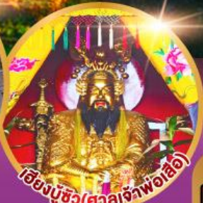
เอ็งบูซิว (ศาลเจ้าพ่อเสือ)

เมนูพิเศษ!! อาหารแต่จิว 18 อย่าง ผ่านพะไลต้นตำรับชัวเถา สุกชีฟู๊ด