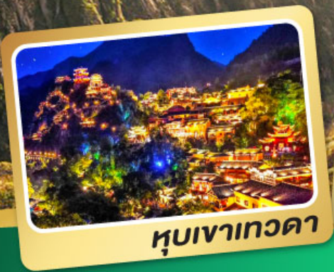
หุบเขาเทวดา