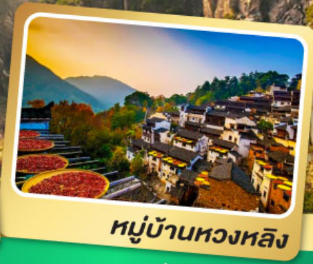
หมู่บ้านหวงหลิง