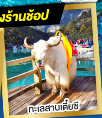
ทะเลสาบเตี้ยซี