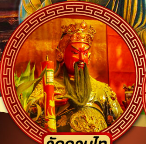
วัดกวนโต