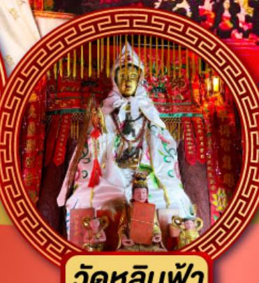
วัดหลินฟ้า