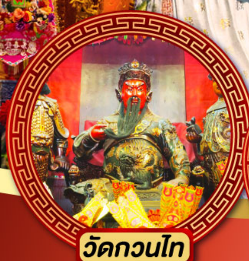
วัดกวนไท