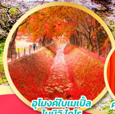
อุโมงค์ไบเมเบิล โมมิจิ ไคโร