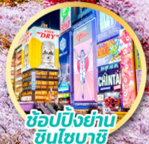
ช้อปปิ้งย่านชินโซบาสึ