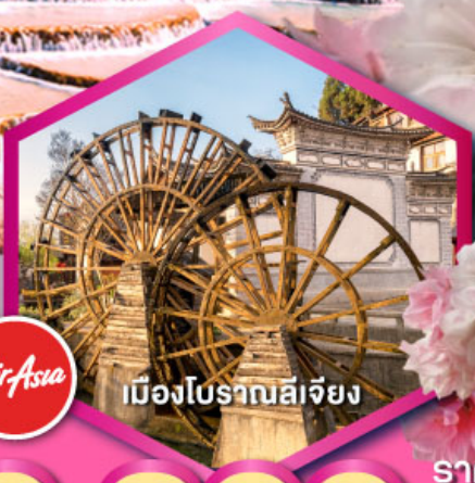
เมืองโบราณลีเจียง