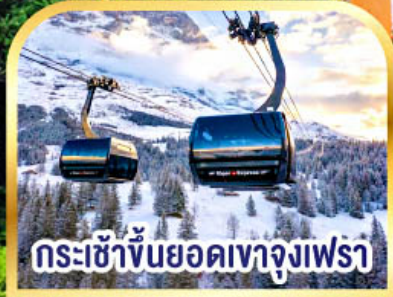
กระเช้าขึ้นยอดเขาจุงเฟรา