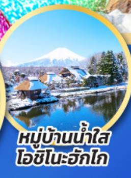
หมู่บ้านน้ำใส ไอชิโนะอัทสึ