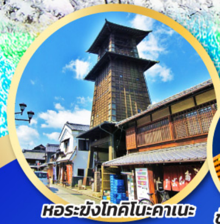
หอรบั้งโทคิโนะคาเนะ