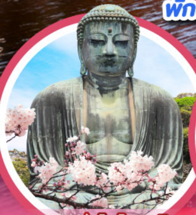
หลวงพ่อดาไคบุตสึ