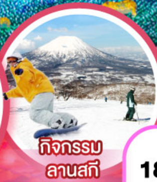
กิจกรรม ลานสกี

เดินทาง 18-23, 21-26 ก.พ. 68 14-19, 20-25 ก.พ. 68